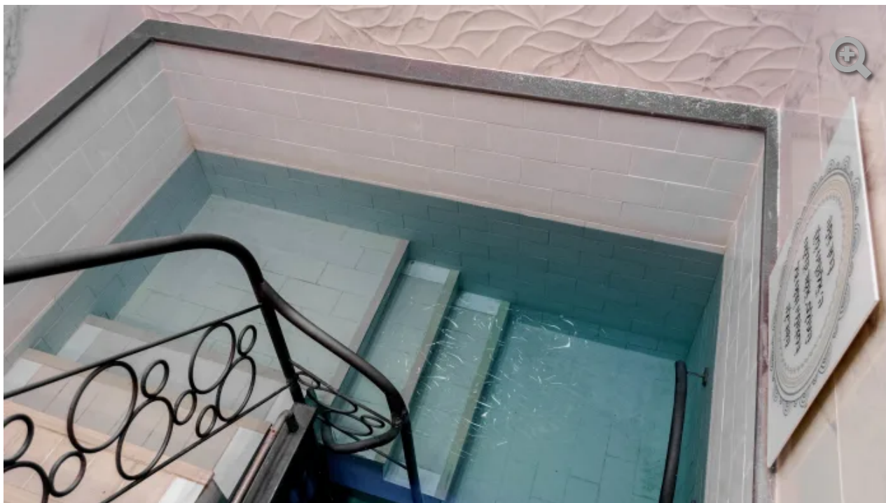
לכל מקווה יש אופי אחר לפי המקום בו הוא נמצא והקונספט הנבחר

שני חדרים מפוארים מהווים חדרי התארגנות במיוחד לכלות ומצטיינים באמבטיות רחבות כאשר האמבטיה הפינתית בסוויטה המרכזית שקועה ברצפה, במקום שהיה בעבר בור טבילה. שידה אומנותית ופריט נגרות קאסטום מייד ושימוש בשיש בגוון שחור עמוק על רקע שיש אפור עם עורקים בולטים בשניהם - ניגודי צבעים המוסיפים לתחושה החגיגית. פינת ההמתנה אף היא מפנקת עם ספה נעימה לישיבה על רקע קיר כחול ומראות עגולות במגוון גדלים שמייצרים תחושה של ישיבה בסלון בוטיק. במקווה נעשה שימוש בספטים וגופי תאורה תלויים והמקום כולו מוקפד עד הפרט האחרון כולל התמרוקים ופינת הקבלה מעץ ועיצוב הפרוזדור היבש והפרוזדור הרטוב המתנהלים כשני עולמות מקבילים אך מתכתבים זה עם זה בעיצוב האחיד.